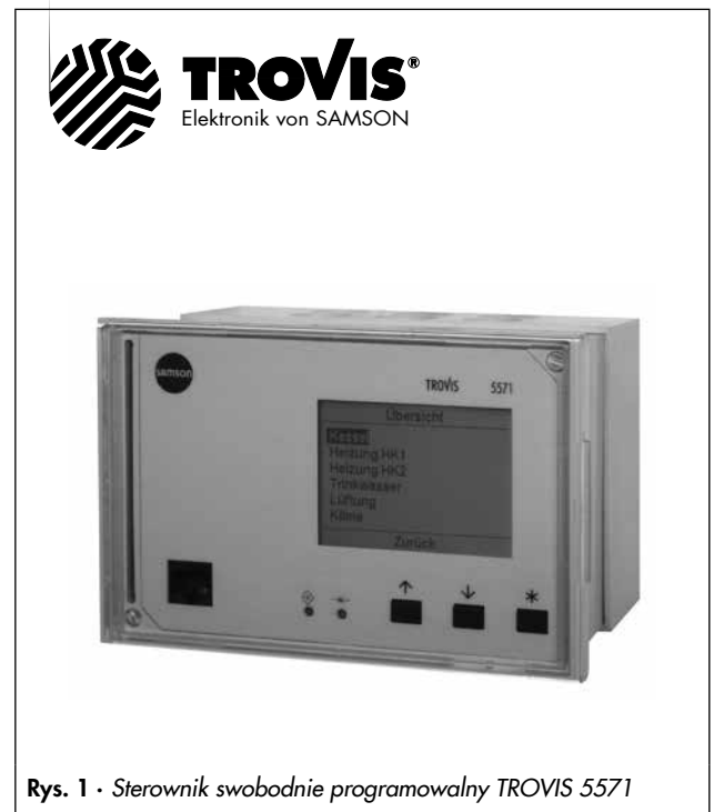
Rys. 1 - Sterownik swobodnie programowalny TROVIS 5571