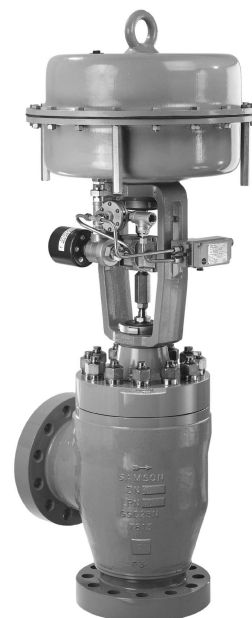
Rys. 2 Zawór regulacyjny typu 3256-1 z siłownikiem pneumatycznym typu 3271