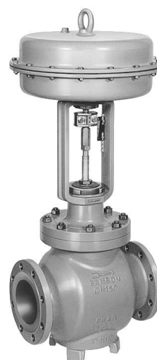
Rys. 1 Zawór regulacyjny typu 3251-1 z siłownikiem pneumatycznym typu 3271